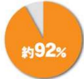
グラフ:大阪ガス調べ(n=338)